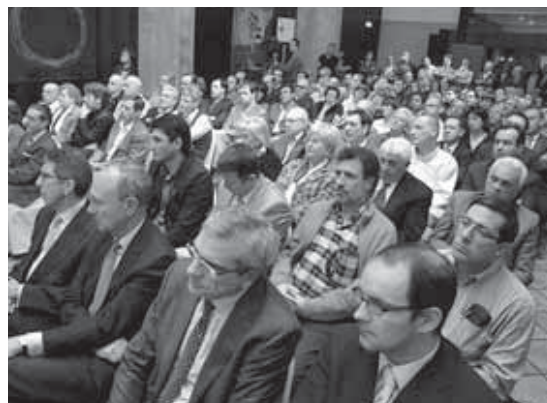
El salón registró un lleno absoluto.