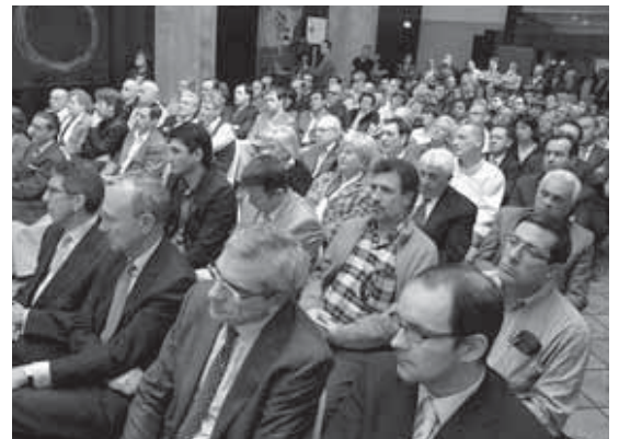
El salón registró un lleno absoluto.