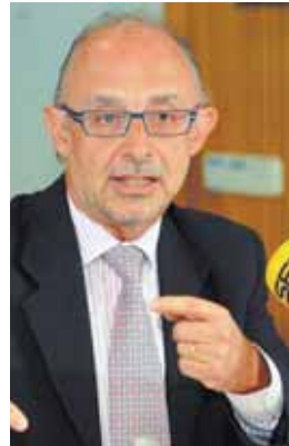
Cristóbal Montoro.